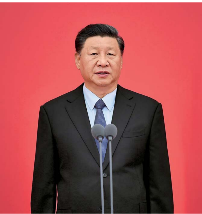
▲8月26日,中国人民警察授旗仪式在人民大会堂举行。中共中央总书记、国家主席、中央军委主席习近平向中国人民警察队伍授旗并致训词。这是习近平致训词。

聚焦实战、强化训练,着力锤炼铁一般的理想信念、铁一般的责任担当、铁一般的过硬本领、铁一般的纪律作风,充分展现党领导的社会主义国家人民警察克己奉公、无私奉献的良好形象。 授旗仪式上,中共中央政治局常委、中央书记处书记王沪宁宣读《中共中央关于授予中国人民警察队伍“中国人民警察警旗”的决定》。 中共中央政治局常委、国务院副总理韩正出席仪式。 参加授旗仪式的人民警察进行了集体宣誓,誓词为:对党忠诚,服务人民,执法公正,纪律严明;坚定纯洁,让党放心,甘于奉献,能拼善赢。 郭声琨主持仪式。丁薛祥、张又侠、陈希、周强、张军出席仪式。中央政法委员会委员,中央和国家机关有关部门负责同志参加仪式。 中国人民警察警旗旗面由红蓝两色组成,红色为主色调,警徽居旗帜左上角。警旗是人民警察队伍的重要标志,是人民警察荣誉、责任和使命的象征。