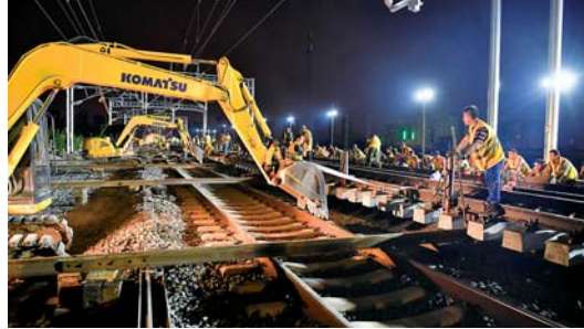
合安高铁将进入动态验收阶段

8月25日,由中铁四局负责施工的合安高铁集贤路联络线42号道岔插铺完成,为合安高铁9月进入动态验收阶段奠定基础。