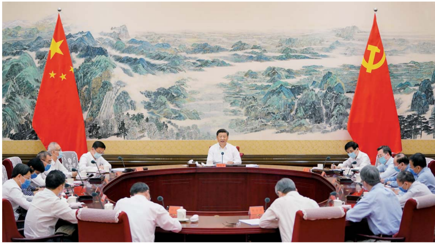
▲8月24日,习近平在中南海主持召开经济社会领域专家座谈会并发表重要讲话。