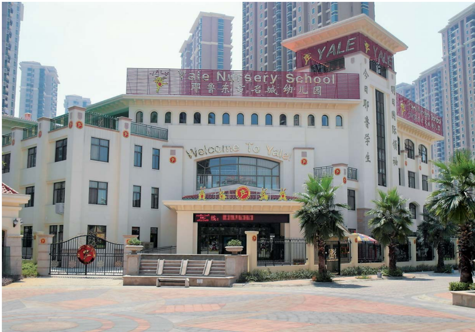
▲图为福州市马尾区耶鲁东方名城幼儿园。

专家建议，转型要精准施策，必须充分考虑地方经济实力、当地既有幼儿园发展现状以及家长意愿，避免“一刀切”