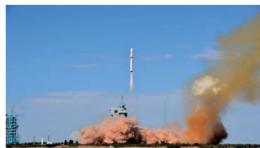
我国成功发射高分九号 05 星

8月23日10时27分,我国在酒泉卫星发射中心用长征二号丁运载火箭,成功将高分九号05星送入预定轨道。