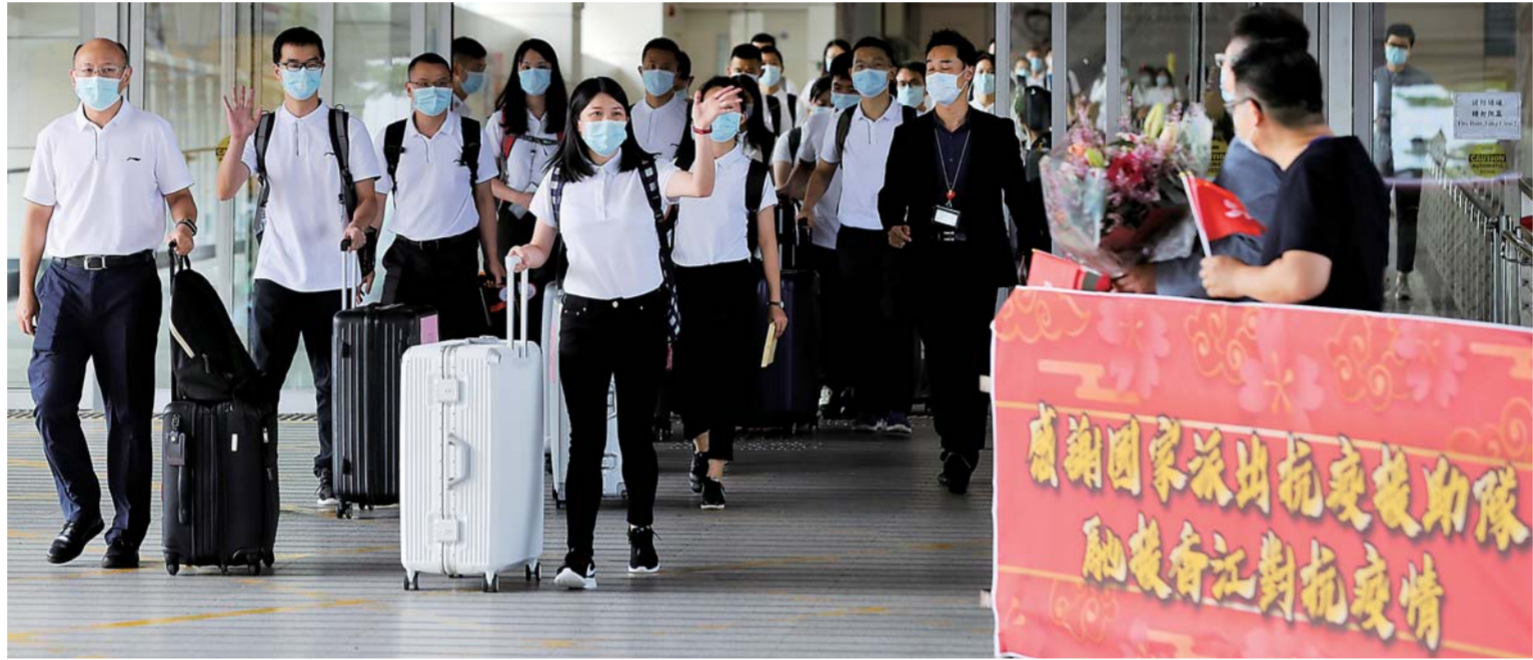
▲8月21日,内地核酸检测支援队抵达香港。

新华社广州/香港8月21日电 继8月初首支“内地核酸检测支援队”的10名先遣队员抵港后,其余50名队员21日下午也来到香港。他们将协助香港特区政府开展核酸检测工作,抗击新冠肺炎疫情。