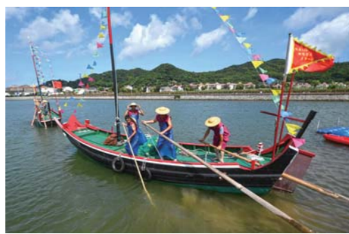
▲蚂蚁岛居民为游客表演木帆船捕鱼(8月1日摄)。

长桥外,东海边,一眼通透,晴空万里。一艘崭新的橙黄色巨轮,依山靠岛静立。 这艘滚装船有13层甲板,能装载7800辆汽车,是国内自主研发的最大型车渡船。近日完成最后工序,这座“移动的小岛”,即将从船厂起航,跨越重洋交付至意大利客户。 船厂依山而建,从空中俯瞰,面积将近整个海岛的三分之一。这名叫蚂蚁岛,镶嵌在浙江舟山市普陀区400多个岛屿之间,像是浮在水面上的一只蚂蚁。 新中国成立后,仅有40条破船板的蚂蚁岛人,驻足2平方公里多一点的弹丸之地,毅然把目光投向了广袤的大海。大捕船,承载了孤岛最初的梦想。 为了加快进发海外捕捞,渔民把自家的铜火窗、蜡烛台、铜面盆、金银首饰捐出来,把镶嵌在衣橱、棉柜、箱子上的金属拆下来,东拼西凑购得一艘大捕船,取名“火窗船”。