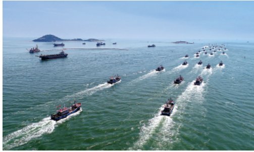
泉州渔船开渔出海

8月16日,历时3个半月的南海伏季休渔结束,海南省陵水黎族自治县新村镇的渔船陆续起航出海,开始海上捕鱼作业。