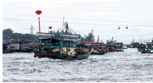
南海伏季休渔结束

8月16日,历时3个半月的南海伏季休渔结束,海南省陵水黎族自治县新村镇的渔船陆续起航出海,开始海上捕鱼作业。