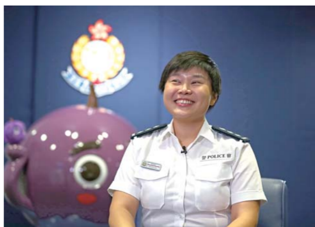
倪采欣总督察在接受新华社记者专访。