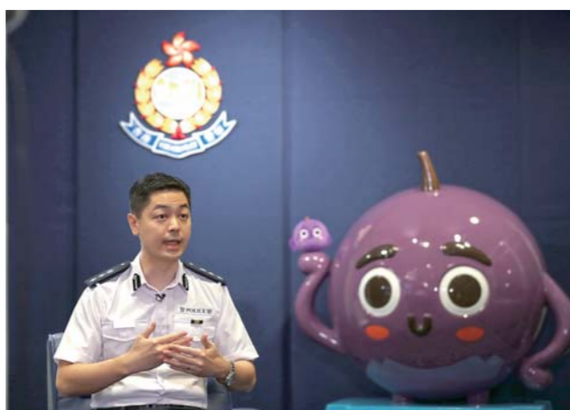
郭嘉铨总警司在接受新华社记者专访。