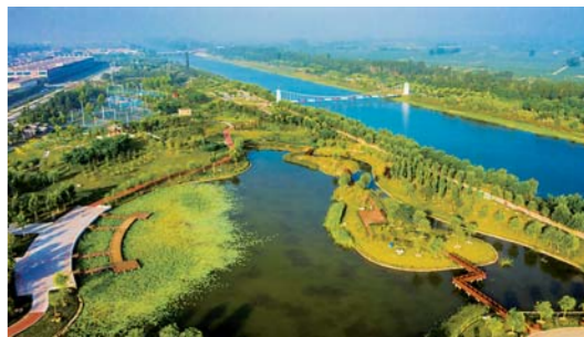
旧河道变身生态公园

7月20日拍摄的武邑县观津公园。近年来，河北省武邑县大力治理境内旧河道，打造“城市绿肺”，为市民提供亲近自然的空间。