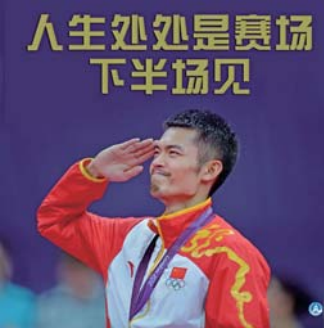
人生处处是赛场 下半场见