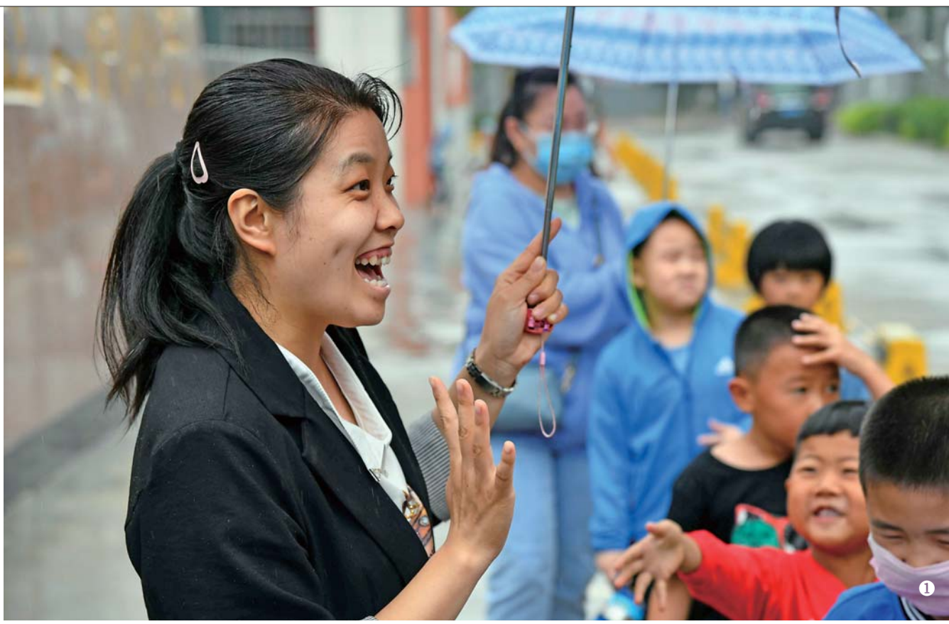
图1:6月23日,在三洞溪村幼儿园,放学后老师送孩子们回家。