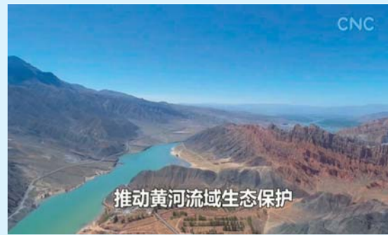
推动黄河流域生态保护

不到一年,习近平总书记4次考察黄河。如何开创黄河流域生态保护和高质量发展新局面?怎样让黄河成为造福人民的“幸福河”?