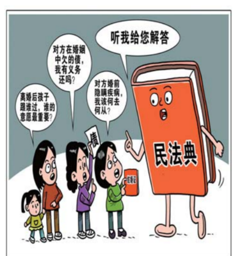
徐韵寒 新华社发 朱慧卿 作

现前夫唐某曾在二人分居期间，以资金周转为由借款100万元。因借款发生在婚姻存续期内，曹某被判负有连带清偿责任。4年多来，曹某因唯一的自有房产被法院执行，不得不带着儿子在外漂泊。2019年，检察机关就此案向法院提起抗诉，曹某终于盼来了改判。