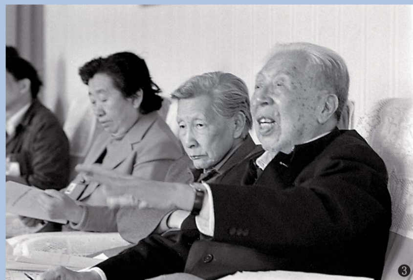
图1：2017年4月18日，在南昌市青云谱区徐家坊街道建北社区，社区居民和工作人员在学习《中华人民共和国民法总则》。《中华人民共和国民法总则》通过意味着民法典编纂完成第一步。图2：1986年4月3日，出席六届全国人大四次会议的四川省代表在分组会议上审议《中华人民共和国民法通则(草案)》。图3：1986年4月2日，出席六届全国人大四次会议的北京市代表在分组会议上审议《中华人民共和国民法通则(草案)》。