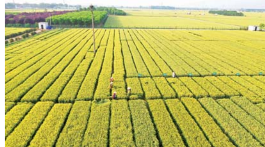
河南温县:麦田美如画

5月15日拍摄的河南省焦作市温县祥云镇小麦博物馆附近的育种麦田,麦浪翻滚,如画般美丽。