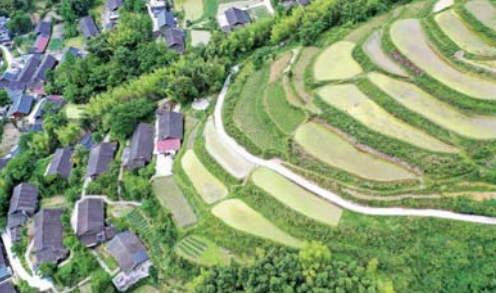
湖北恩施:梯田忙插秧

5月15日,湖北恩施州宣恩县高罗镇大茅坡营村,蓄水的梯田,插秧的农民与苗寨民居构成一幅美丽的农耕画卷。