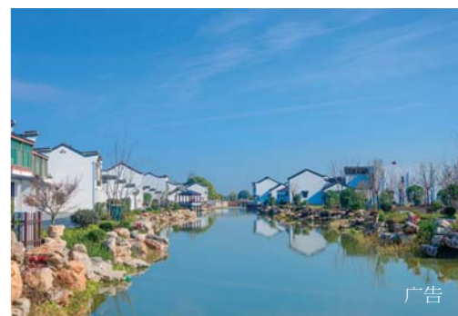
浙江省湖州市南浔区特色小镇之一的千古镇“童荫小镇”，畅享彩色小镇的梦幻童话之旅。