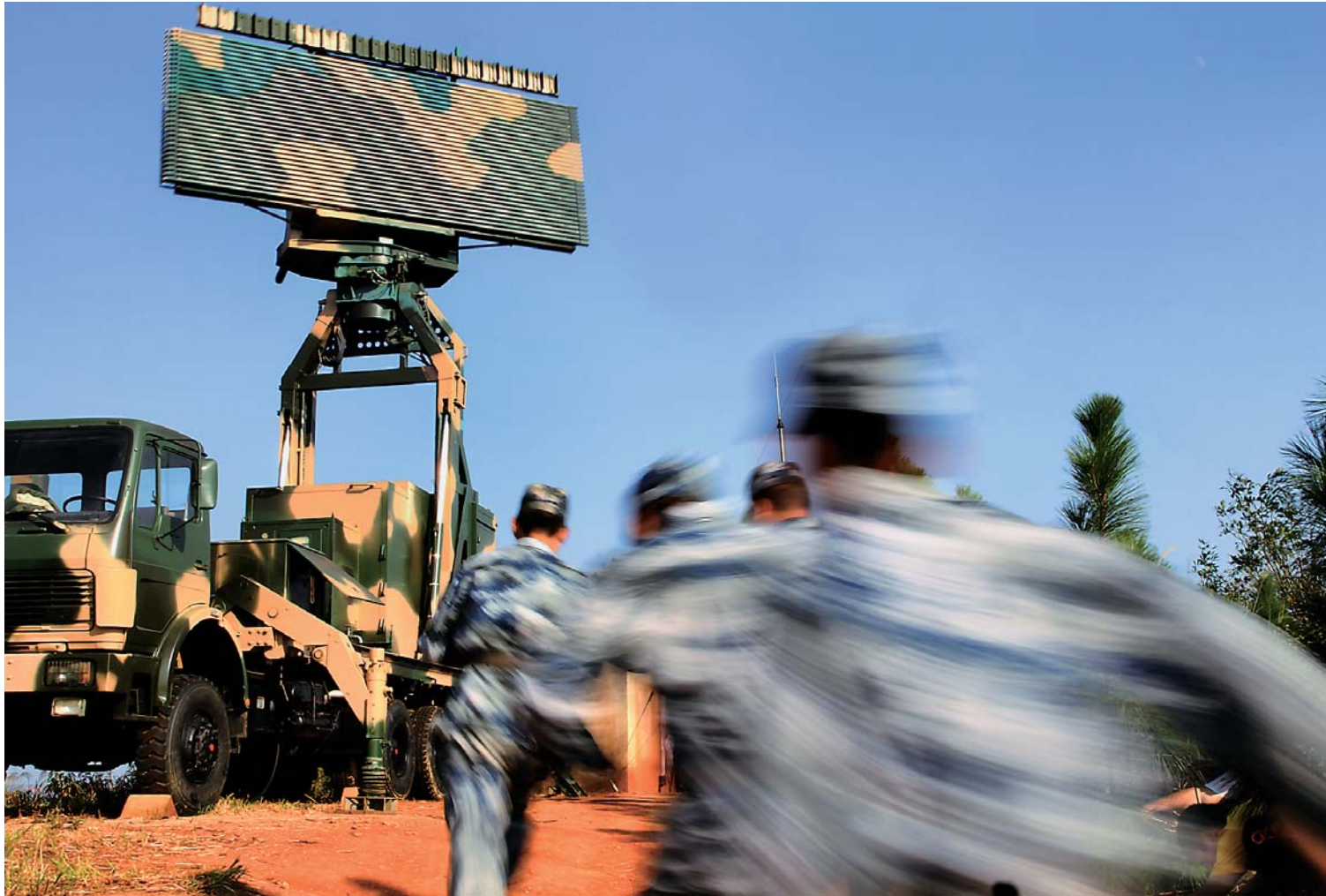
▲空军某雷达机动分队官兵进行战斗等级转进(2015年10月21日摄)。

从深海小岛到荒漠边陲,从白山黑水到西域雪峰,靠着刀劈斧凿、爬冰卧雪、人背马驮,雷