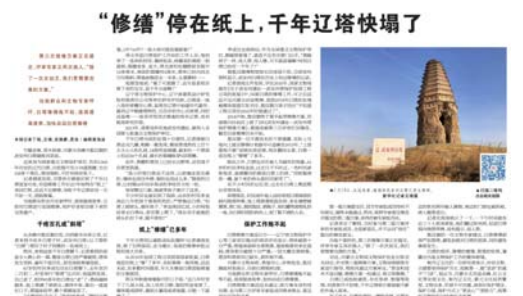
▲《新华每日电讯》曾于2020年4月20日刊发“修缮”停在纸上,千年辽塔快塌了》一文,图为该报道的版面截图。

武安州辽代白塔位于内蒙古自治区赤峰市敖汉旗丰收乡白塔子村。2013年,该塔及所在地武安州遗址被列入全国第七批重点文物保护单位。