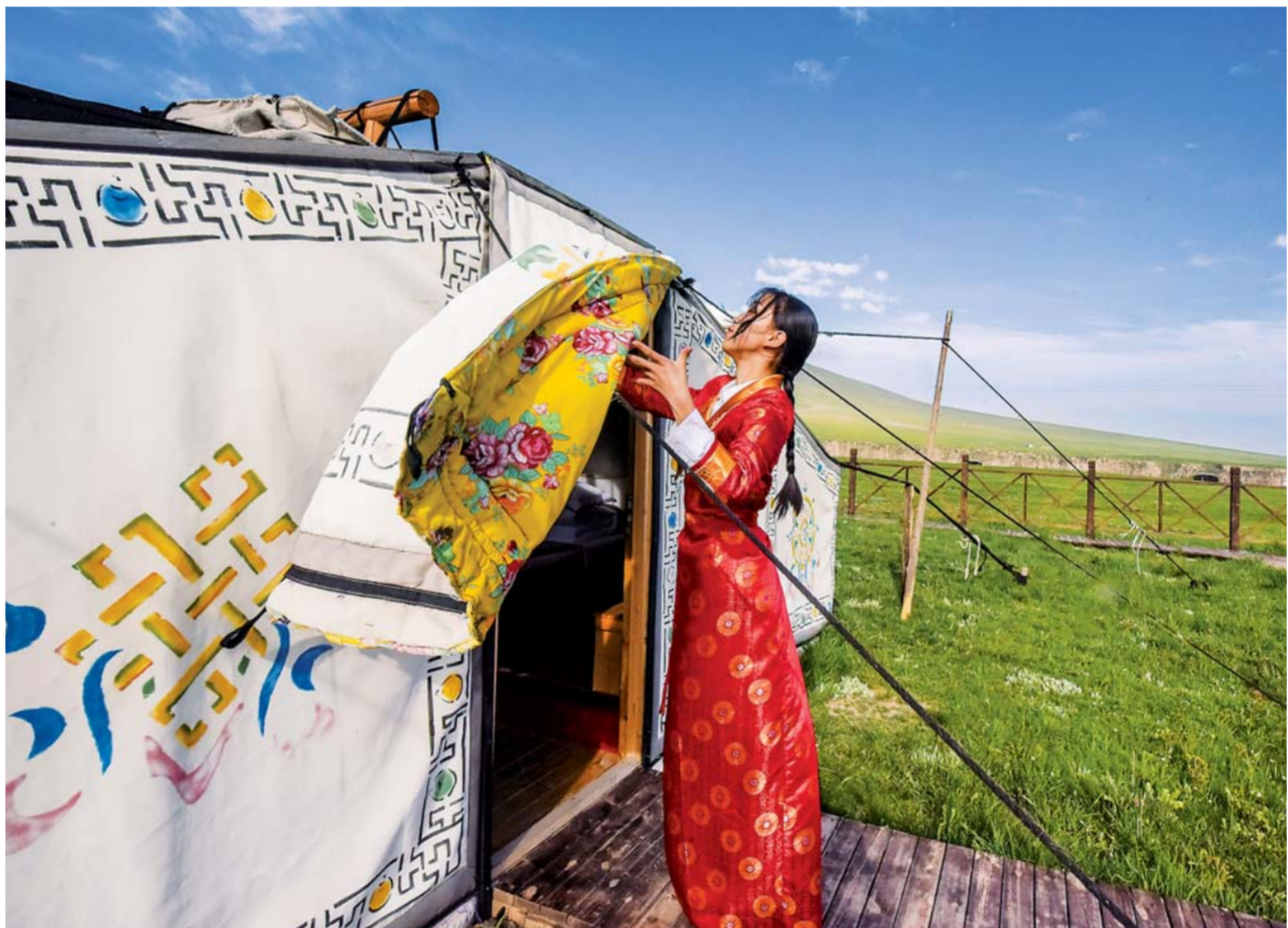
▲祁连山生态牧场的一名工作人员在收拾帐篷宾馆(2019年6月20日摄)。新华社记者吴刚摄

新华社西宁4月21日电(记者骆晓飞、白玛央措)21日，青海省人民政府发布公告，经专项评估检查，民和回族土族自治县等17个贫困县(区)达到脱贫退出标准。至此，青海全省42个贫困县(市、区、行委)全部退出贫困县序列。