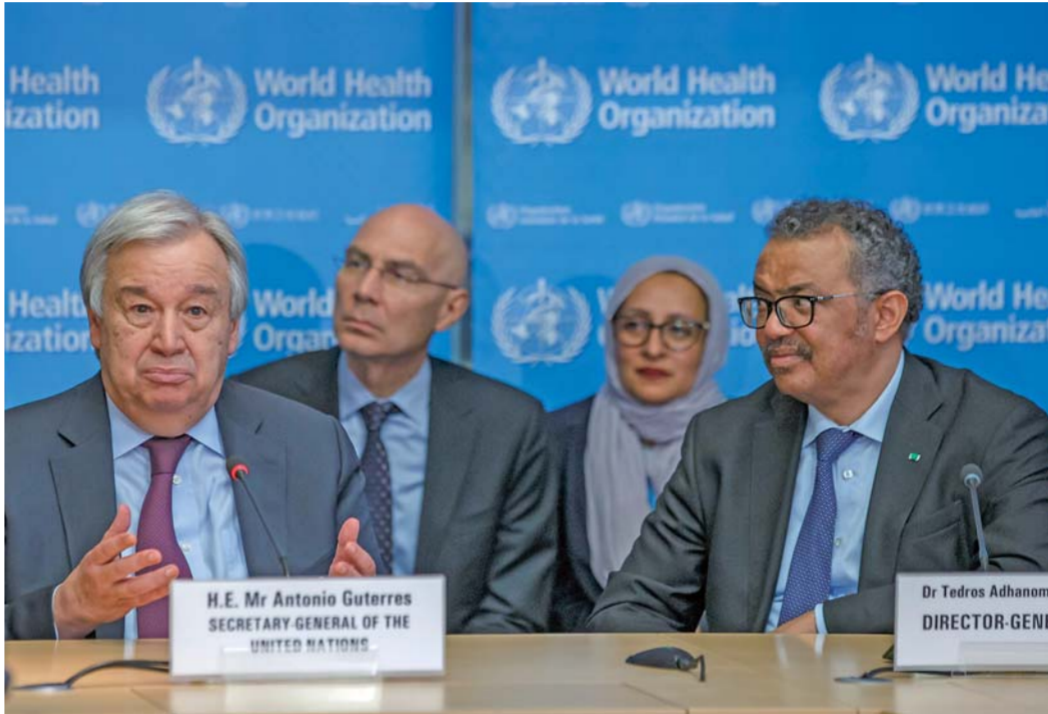
▲2月24日，在瑞士日内瓦，联合国秘书长古特雷斯(左)在世界卫生组织总部发表讲话。

全球抗疫行动中，世卫组织亟需大量资金推动疫苗研发、向医护人员提供防护设备、为防疫能力薄弱国家提供支持等。关键时刻，美方不仅不贡献力量，反而恶意“拆台”，从拖欠世卫会费、挑刺找茬到直接暂停缴费，一系列恶劣行径不仅严重违背契约精神，有失大国担当，而且背