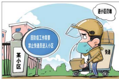
仍有困难 新华社发 王鹏作

部分地区基层治理存在慢作为、不敢为，怕出事而不做事，导致中央的政令难落地，居民群众的正常需求无法满足