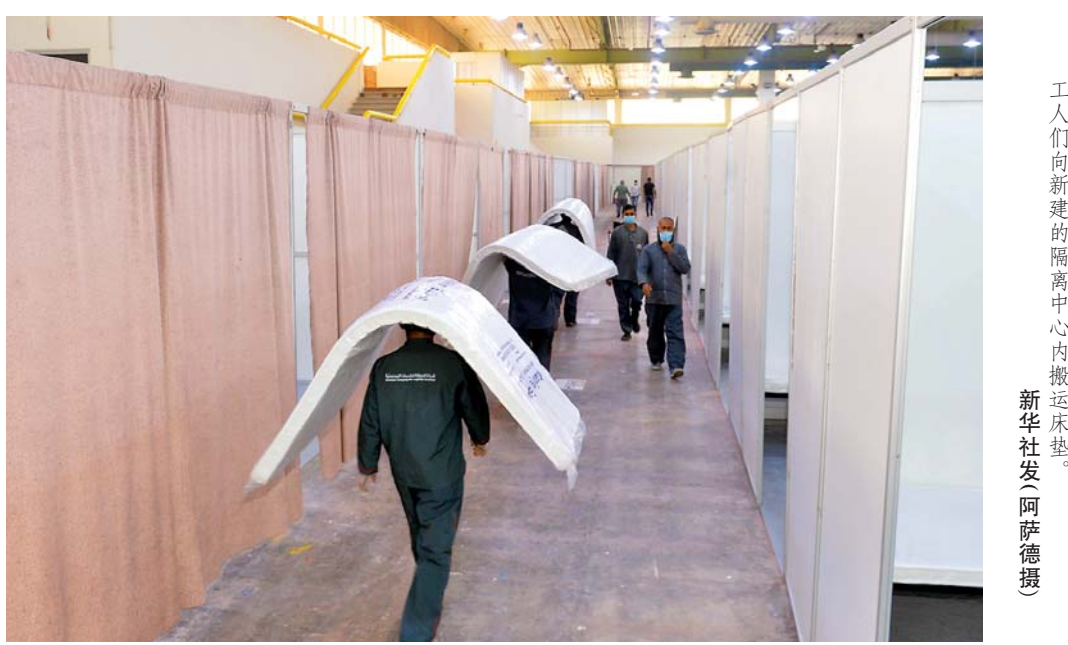
▲4月6日，在科威特哈利法国际机场，工人们向新建的隔离中心搬运帐篷。