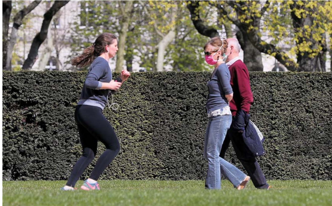
▲4月6日，人们在比利时布鲁塞尔的五十年纪念公园跑步、散步。