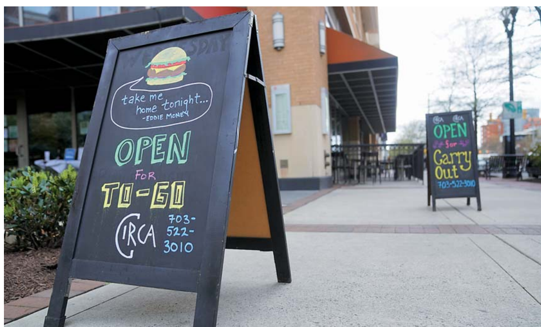
▲这是4月4日在美国弗吉尼亚州阿灵顿拍摄的一家提供外卖服务的餐厅。