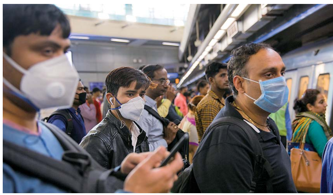
▲3月13日，在印度新德里一地铁站内，民众佩戴口罩出行。