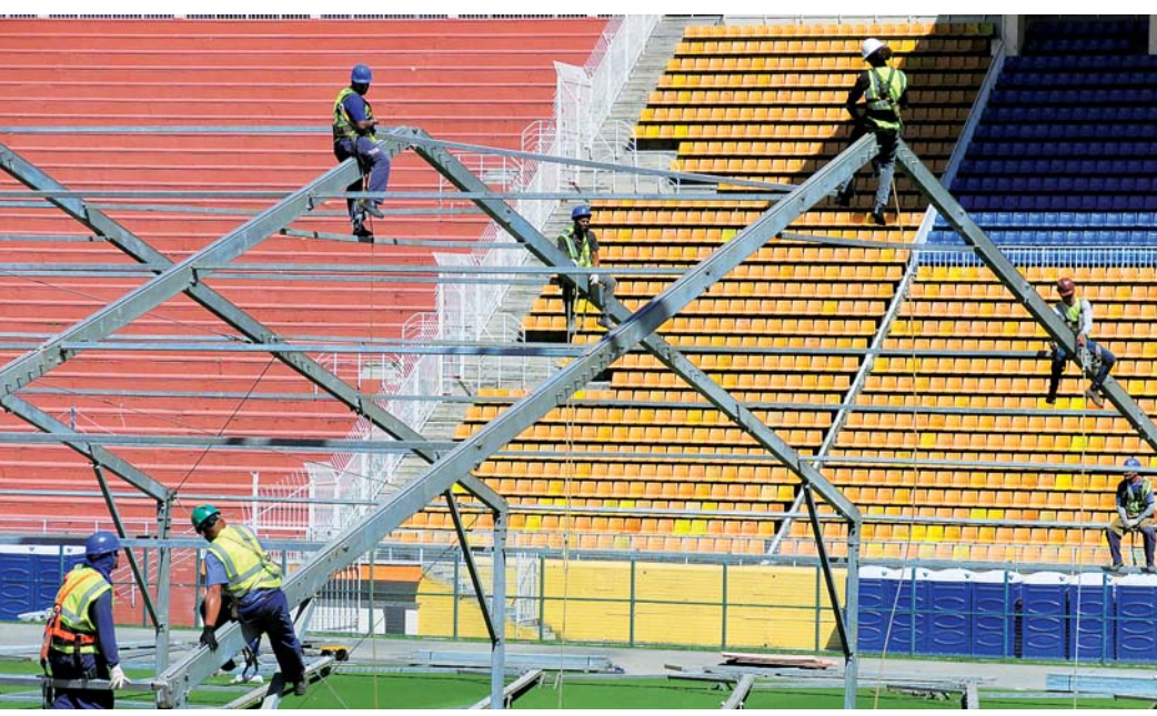
▲3月23日，建筑工人在巴西圣保罗市的帕卡恩布体育场内建造“方舱医院”。