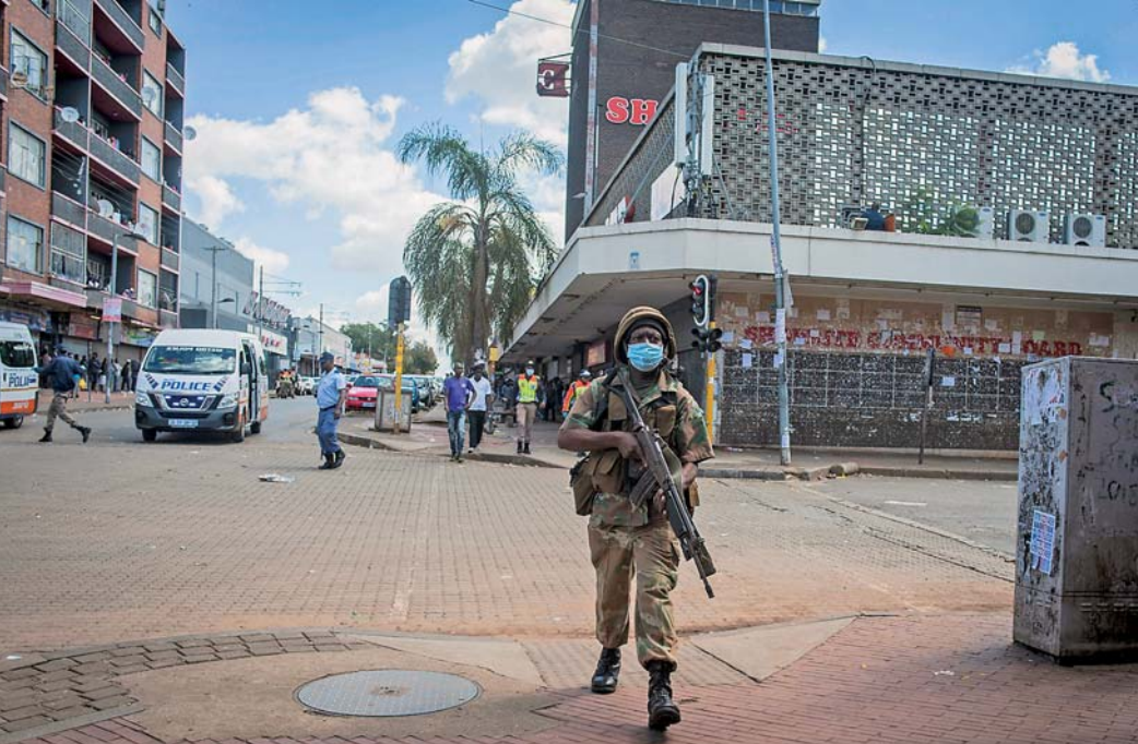
▲4月5日，在南非约翰内斯堡，军警联合执法队在街上巡逻。