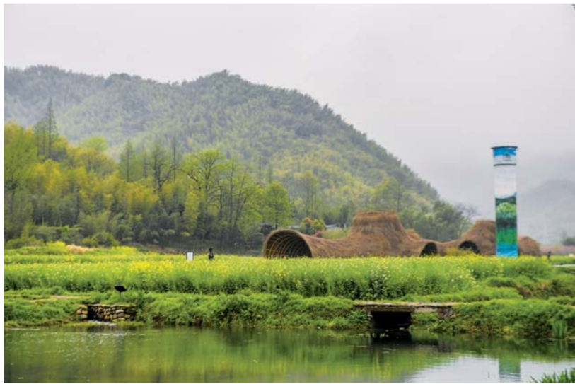
▲浙江省安吉县天荒坪镇余村春日景色(3月31日摄)。