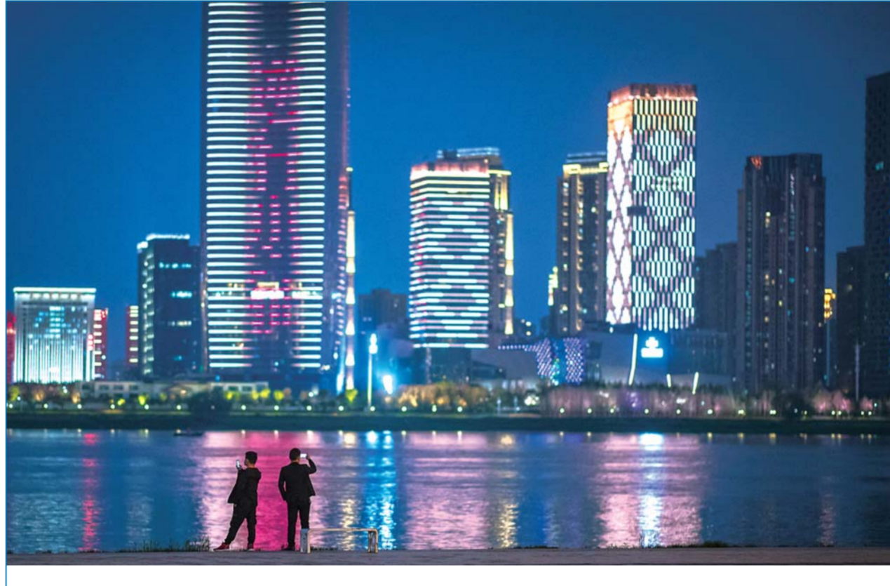
▲4月1日，市民在汉口江滩欣赏江景。随着疫情防控形势好转，遛狗、锻炼身体、吃热干面、到江边散步……这些武汉人的生活日常正在逐渐恢复，人们熟悉的生活已经在回来的路上。

佐科表示，在习近平主席领导下，中国人民抗击疫情取得重要成果，值得世界借鉴。感谢中方为印尼抗击疫情提供物资援助和宝贵支持，这对印尼非常重要。病毒无国界，是人类共同敌人。印尼坚决反对任何污名化行为，愿同中方一道，推动国际社会加强团结合作。印尼期待同中方深化合作，推动两国关系发展。