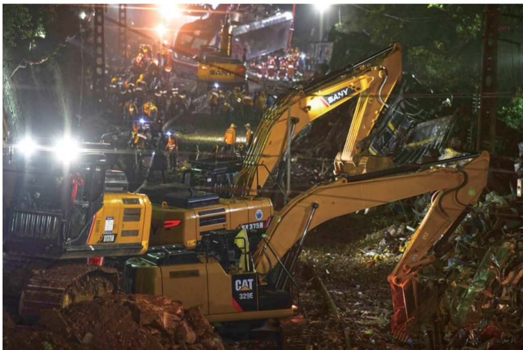
▲3月30日晚，工程机械在京广铁路郴州段脱轨事故现场作业。

同时，条例还明确了物业管理委员会成员及其决策程序中业主代表的比例，即双过半原则。作为临时机构，物业管理委员会一般任期不超过3年。