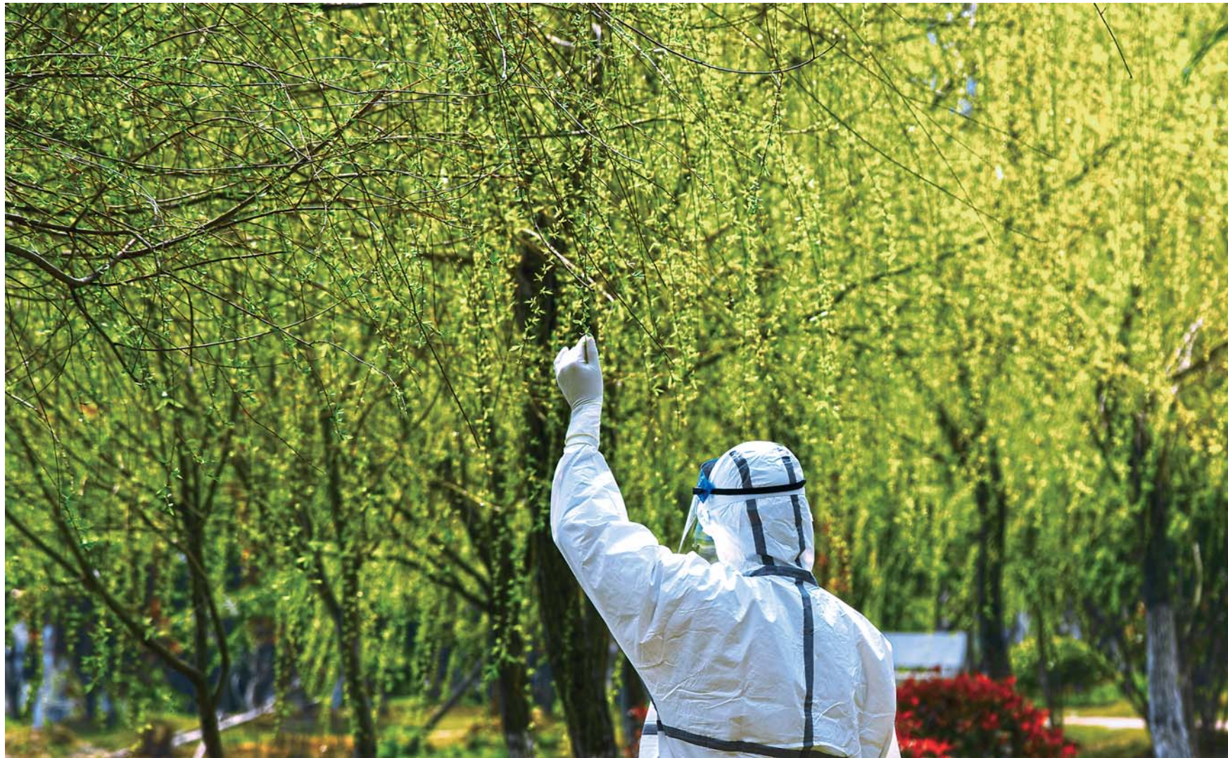
▲3月14日，在华中科技大学同济医学院附属同济医院光谷院区，一位医护人员伸手触摸刚刚发芽的柳枝。随着气温升高，春意在武汉的枝头萌动，花朵渐次开放。

习近平在慰问电中强调，不久前欧盟及成员国以多种形式对中国疫情防控表达慰问和支持。团结就是力量。当前形势下，中方坚定支持欧方抗击疫情的努力，愿积极提供帮助，协助欧方早日战胜疫情。中方秉持人类命运共同体理念，愿同欧方在双边和国际层面加强协调合作，共同维护全球和地区公共卫生安全，保护双方人民和世界各国人民生命安全和身体健康。习近平强调，我高度重视中欧关系发展，愿同欧方一道努力，深化中欧四大伙伴关系和全面战略合作伙伴关系，为世界和平、稳定、繁荣作出积极贡献。