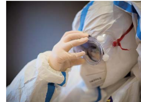
▲海军军医大学医疗队员在穿戴防护服(1月27日摄)。