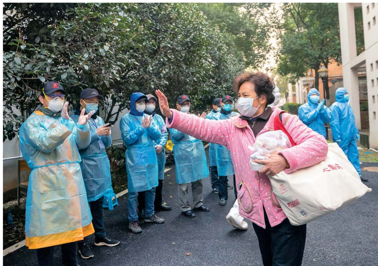
三月十日，在武汉软件工程职业学院复学驿站，一百四十三名治愈出院后的新冠肺炎患者，在此进行十四天医学观察后，达到医学标准，成功解除隔离。解除隔离的治愈患者走出复学驿站后对工作人员表示感谢。