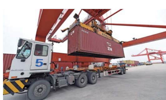
合肥港：实现有序复工复产

这是2月19日拍摄的合肥港国际集装箱码头。近日，合肥港在做好新冠肺炎疫情防控的基础上，有序实现复工复产。