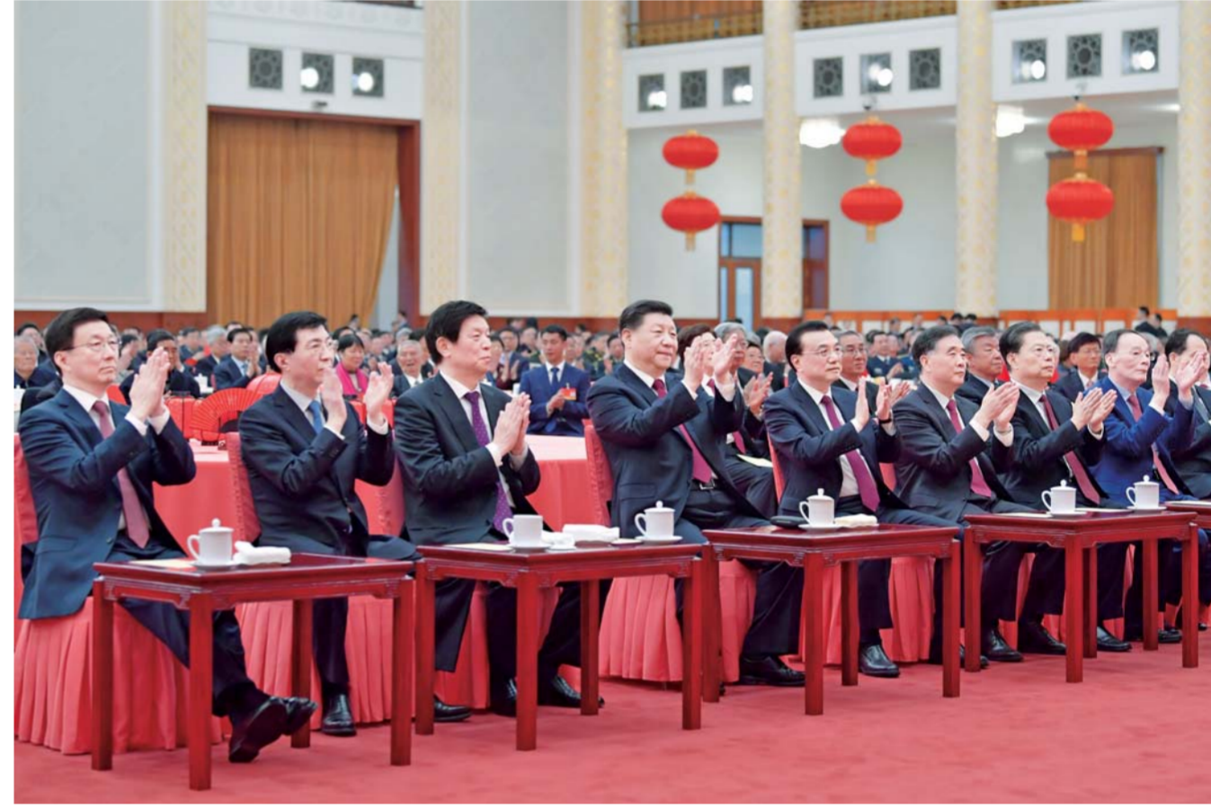
▲1月23日，中共中央、国务院在北京人民大会堂举行2020年春节团拜会。中共中央总书记、国家主席、中央军委主席习近平发表讲话。