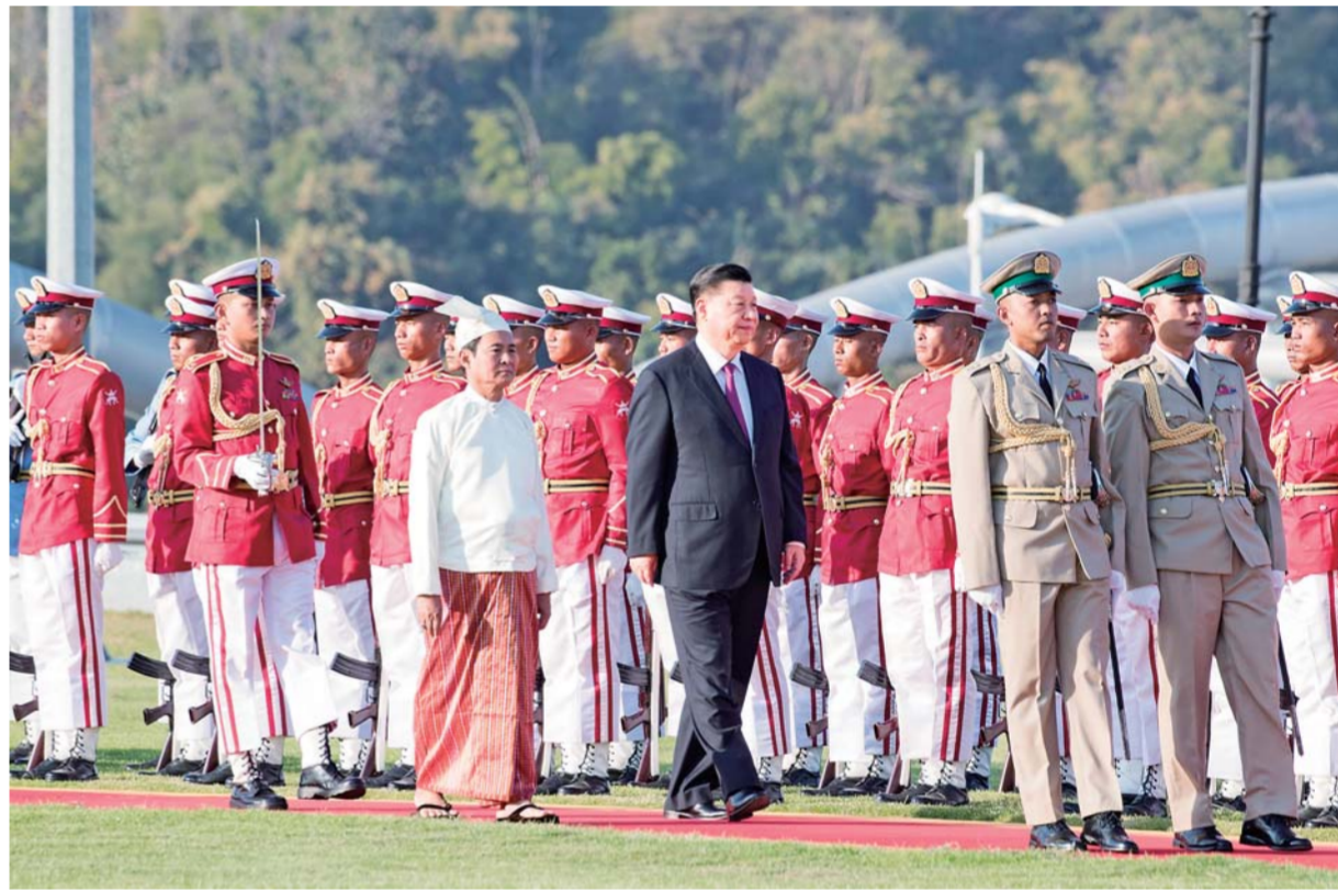
▲当地时间1月17日下午,国家主席习近平在内比都总统府出席缅甸总统温敏举行的隆重欢迎仪式。这是习近平在温敏陪同下检阅仪仗队。