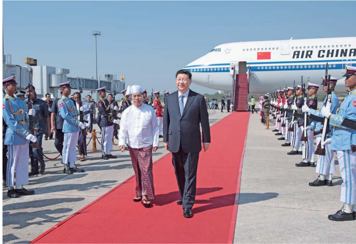
▲当地时间1月17日下午,国家主席习近平乘专机抵达内比都国际机场,开始对缅甸联邦共和国进行国事访问。习近平抵内比都时,缅甸第一副总统敏瑞率多名内阁部长在舷梯旁热情迎接。