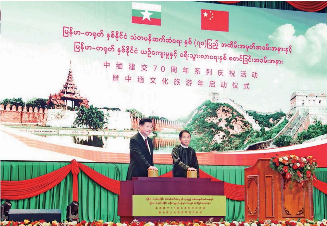
▲当地时间1月17日晚,国家主席习近平在内比都第二国际会议中心出席中缅建交70周年系列庆祝活动暨中缅文化旅游年启动仪式。这是习近平和缅甸总统温敏共同按下按钮,正式启动中缅文化旅游年。

新华社内比都1月17日电(记者霍小光、李忠发、骆珺)当地时间1月17日晚,国家主席习近平在内比都第二国际会议中心出席中缅建交70周年系列庆祝活动暨中缅文化旅游年启动仪式。缅甸总统温敏、国务资政昂山素季、缅甸第一副总统敏瑞、第二副总统亨利班提育、联邦议会议长兼人民院议长蒂昂密、民族院议长曼温凯丹、国防军总司令敏昂莱、全体内阁成员等出席。