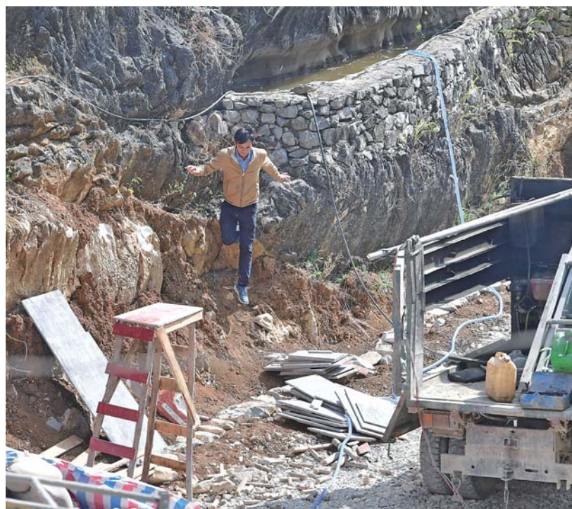
▼韦德王驾车下屯途中，经常要下车将大石块搬走(2019年12月16日摄)。