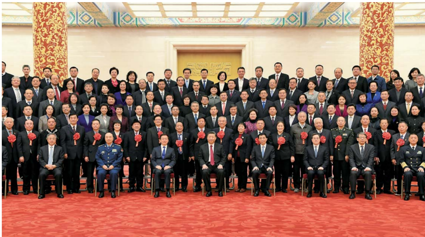
▲12月16日,党和国家领导人习近平、王沪宁、韩正等在北京人民大会堂会见全国离退休干部先进集体和先进个人代表。