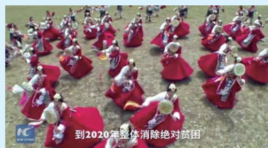
到2020年整体消除绝对贫困

中国将实现全面消除贫困目标,此时的藏族同胞生活水平究竟怎么样? “洋记者”珍妮·伊文涅斯来到西藏,带领大家入民居、进作坊、下田间、上舞台,看一看普通藏族同胞的脱贫新生活。