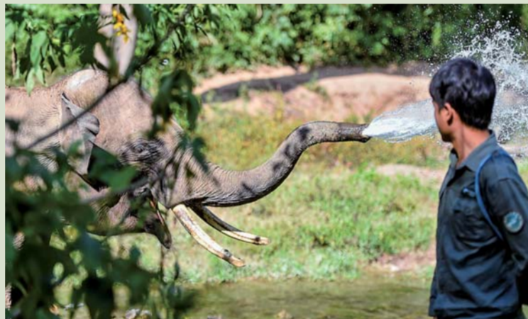
▲11月13日，一只亚洲象在野化训练时用鼻子喷水嬉戏。