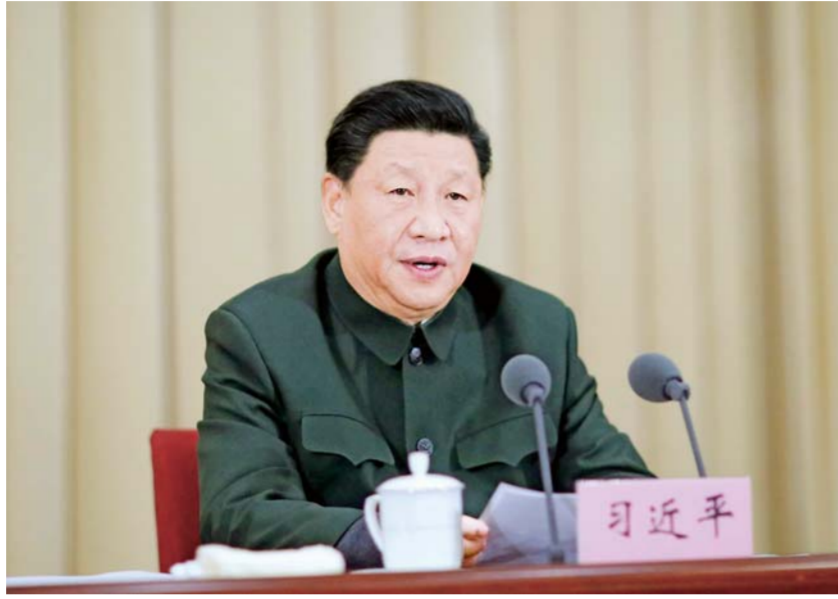
▲11月27日上午,全军院校长集训在国防大学开班。中共中央总书记、国家主席、中央军委主席习近平出席开班式并发表重要讲话。