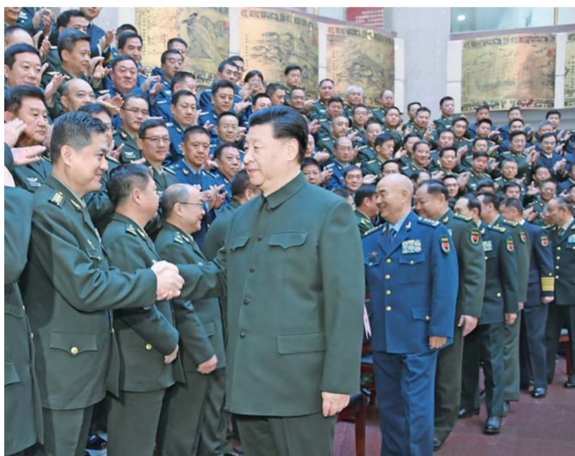
▲11月27日上午,全军院校长集训在国防大学开班。中共中央总书记、国家主席、中央军委主席习近平出席开班式并发表重要讲话,代表党中央和中央军委,向全军院校长和军事教育战线的同志们致以诚挚问候。这是习近平亲切接见集训班全体学员。

新华社北京11月27日电(记者梅世雄、刘济美)全军院校长集训27日上午在国防大学开班。中共中央总书记、国家主席、中央军委主席习近平出席开班式并发表重要讲话,代表党中央和中央军委,向全军院校长和军事教育战线的同志们致以诚挚问候。他强调,强军之道,要在得人。要全面贯彻新时代军事教育方针,全面实施人才强军战略,全面深化军事院校改革创新,把培养人才摆在更加突出的位置,培养德才兼备的高素质、专业化新型军事人才。 上午10时30分许,习近平来到国防大学。在热烈的掌声中,习近平亲切接见集训班全体学员,同大家合影留念。 习近平在讲话中指出,发展军事教育,必须有一个管总的方针,解决好培养什么人、怎样培养人、为谁培养人这个根本问题。新时代军事教育方针,就是坚持党对军队的绝对领导,为强国兴军服务,立德树人,为战育人,培养德才兼备的高素质、专业化新型军事人才。新时代军事教育方针是做好军事教育工作的基本遵循,要全面准确学习领会,毫不动摇贯彻落实。 习近平强调,要全面实施人才强军战略,全面深化军事院校改革创新,推动院校建设加快转型升级。要在全军院校教育和人才培养体系中审视办学定位,加强院校建设顶层设计和长远谋划,形成职能清晰、有机衔接的办学育人格局。要加强学科专业建设,聚焦强军目标要求,坚持战斗力标准,健全动态调整机制,加强与课程和教材为重点的教学体系建设,加强院校科研同教学的结合。要打造高水平师资队伍,教育引导广大教员坚定理想信念、加强理论武装、立德修身、潜心治学,加大领军拔尖人才、中