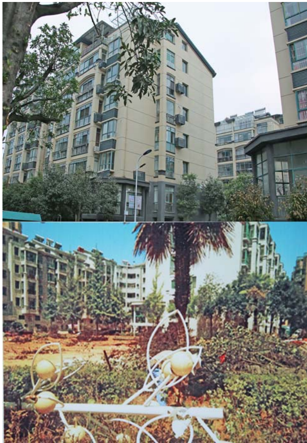
▲拼版图片:上图为11月12日拍摄的江西省九江市武宁县心怡水湾小区改造后的景象;下图为6月21日拍摄的小区改造前的景象。

的村规我作主——每一条款都要确保经过广大村民充分讨论、认可,每个村规民约都是结合本村组特征特点“量身定制”;落实执行人管——每个村组都选出说话好使的人组成“村规民约监督执行理事会”。