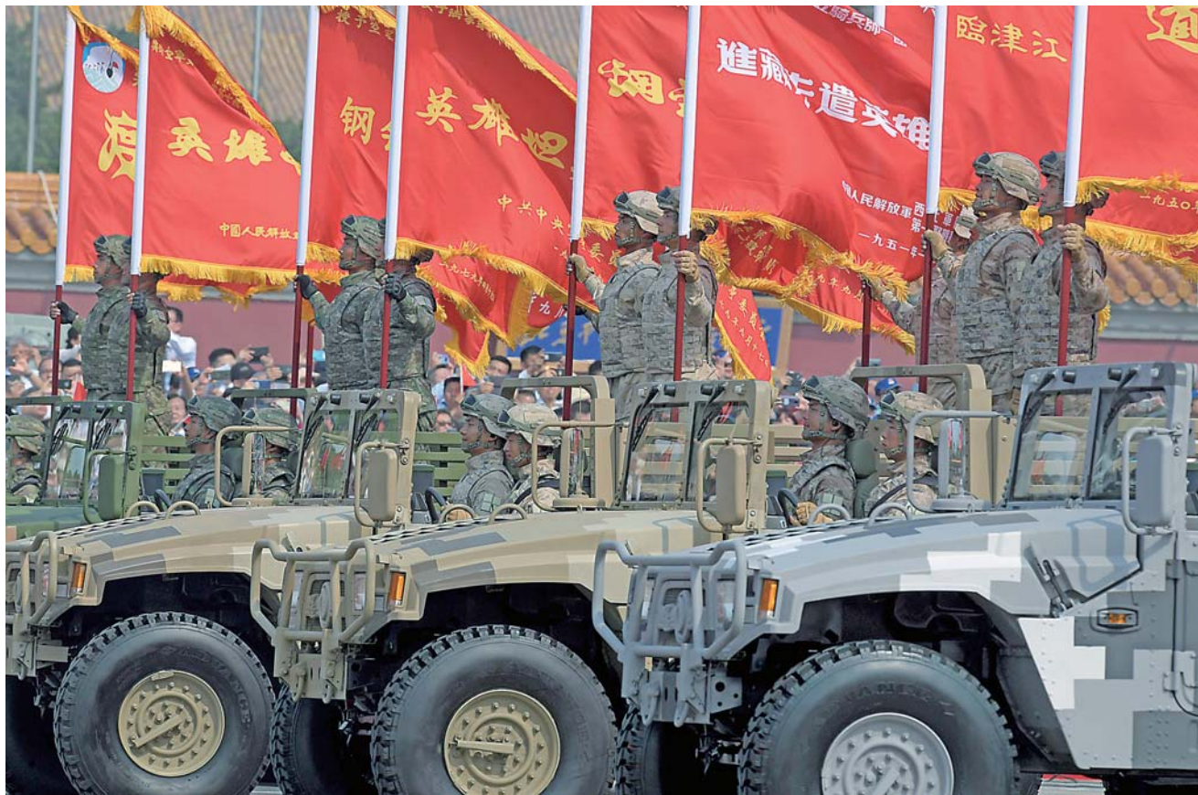
▲10月1日,在庆祝中华人民共和国成立70周年阅兵仪式上,战旗方队接受检阅(资料图片)。