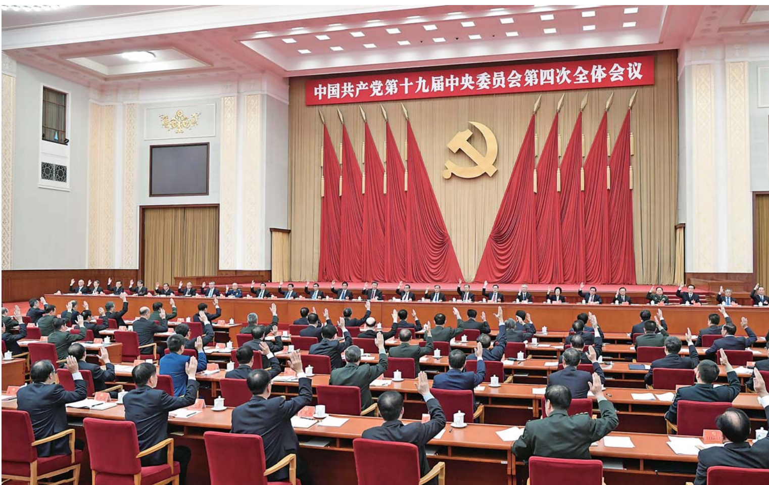
▲中国共产党第十九届中央委员会第四次全体会议，于2019年10月28日至31日在北京举行。中央政治局主持会议。