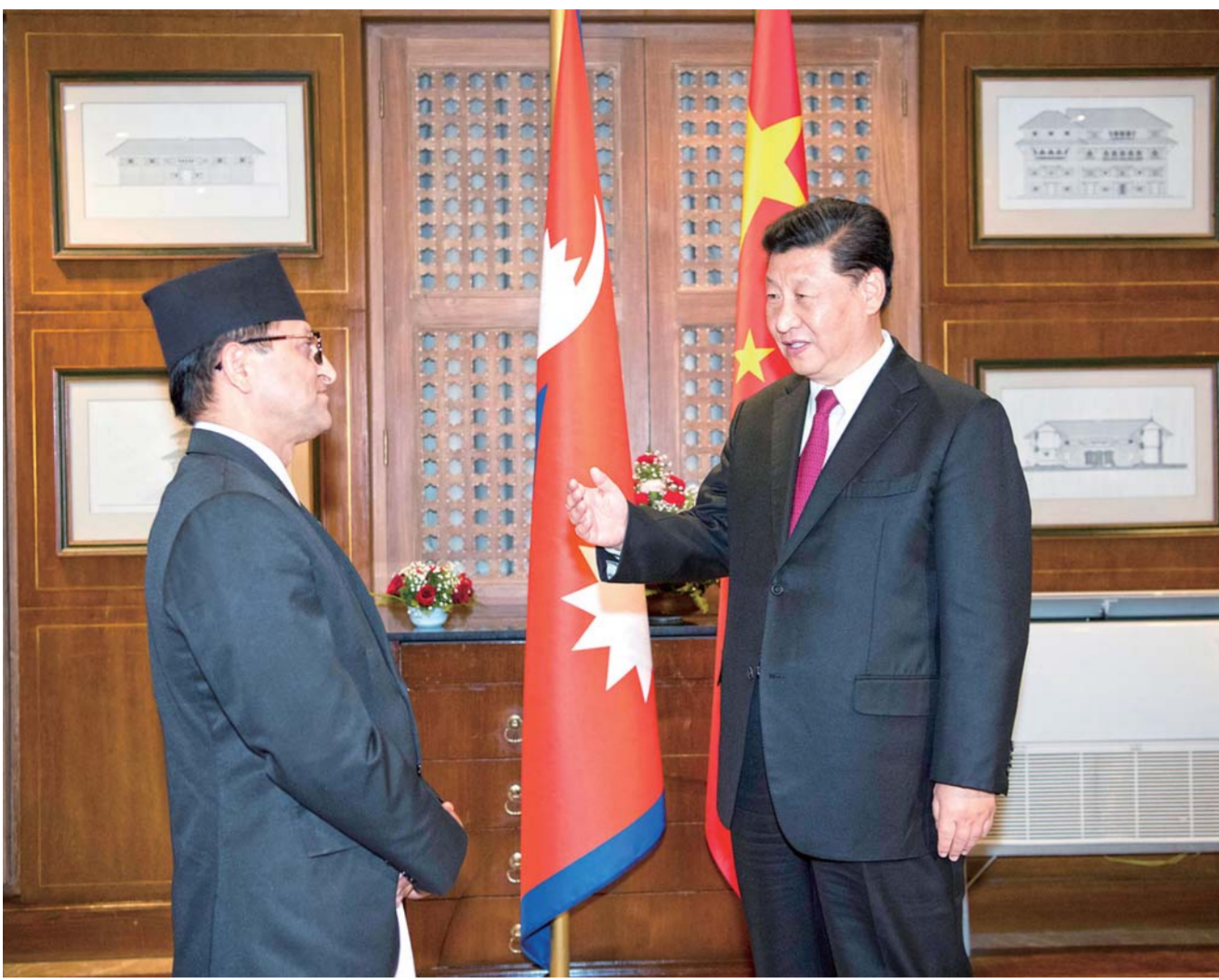
▲10月12日，国家主席习近平在加德满都下榻饭店会见尼泊尔联邦议会联邦院主席蒂米尔西纳。

新华社加德满都10月12日电（记者黄尹甲子、郝薇薇）国家主席习近平12日在加德满都下榻饭店会见尼泊尔联邦议会联邦院主席蒂米尔西纳。