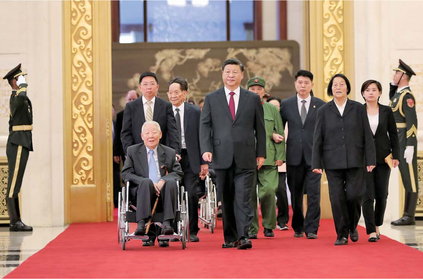
▲9月29日,中华人民共和国国家勋章和国家荣誉称号颁授仪式在北京人民大会堂金色大厅隆重举行。中共中央总书记、国家主席、中央军委主席习近平向国家勋章和国家荣誉称号获得者颁授勋章奖章并发表重要讲话。