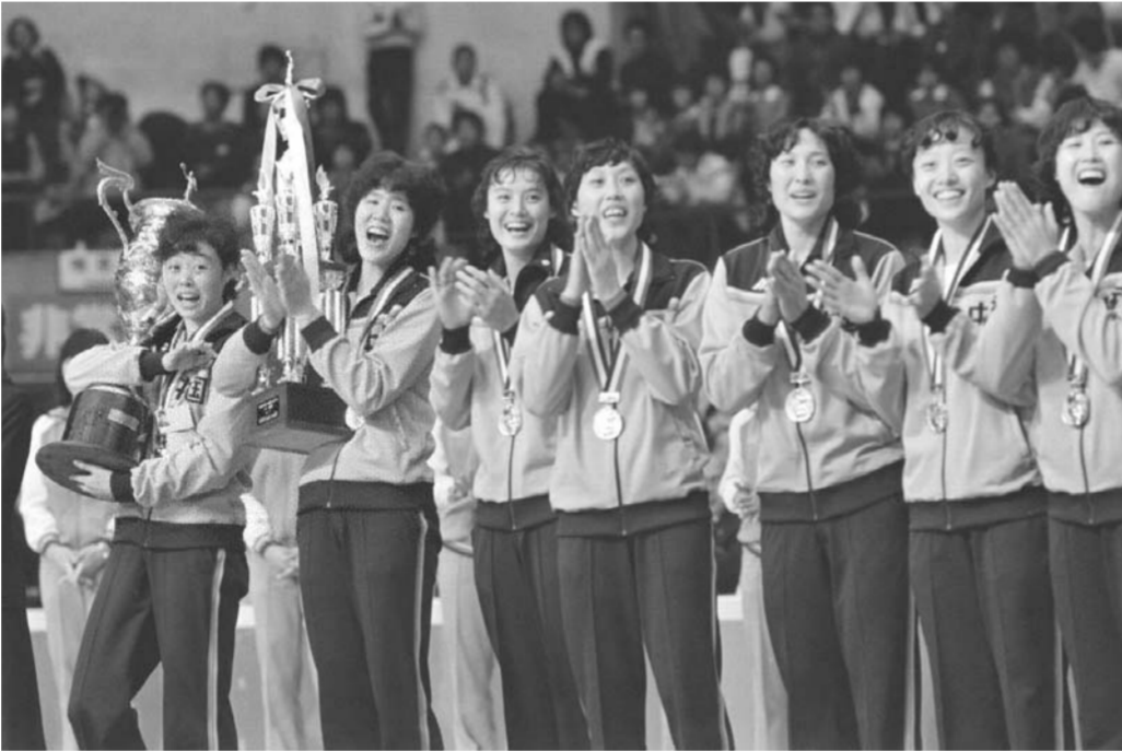
▲1981年11月16日，中国女排队员在第三届女排世界杯颁奖仪式上，这是女排第一次登上世界冠军的领奖台。

外交坚冰打破后，已经颇具实力的中国体育代表团开始在世界舞台上不断突破。1979年，体育界率先喊出了“ 冲出亚洲，走向世界 ”，在改革开放之初的各行各业引起巨大反响。1981年3月20日，中国男排在世界杯预选赛上绝地反击战胜韩国队，拿到世界杯参赛权。“ 团结起来，振兴中华 ”的口号作为青年学子立志报国的宣言，从燕园响彻神州大地，奏响了时代最强音。