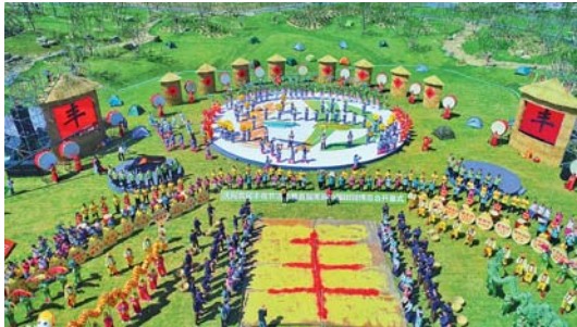
美丽中国田园博览会

9月23日,“田园德清·博览中国”庆祝农民丰收节活动暨首届美丽中国田园博览会,在浙江德清开幕。