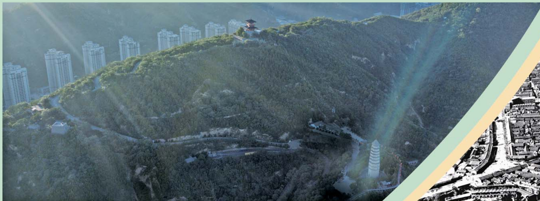
▲8月29日航拍的延安市宝塔山。