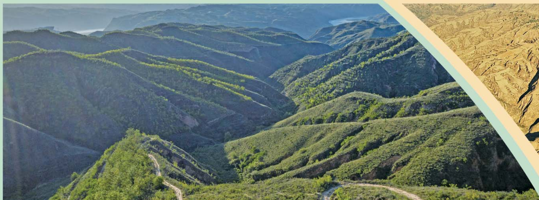
▲延安市延川县晋陕大峡谷,两岸青山相对(8月14日无人机拍摄)。经过多年的持续绿化,延川县让树木很难成活的晋陕大峡谷披上了绿装。