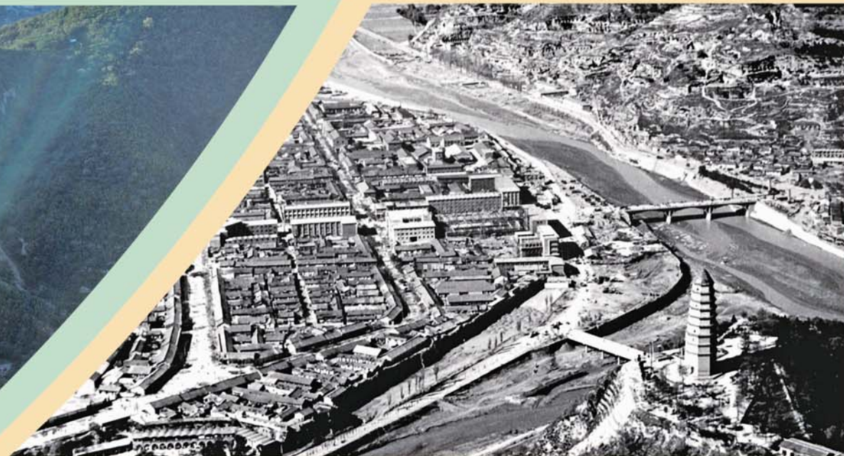
▲上世纪70年代的延安。