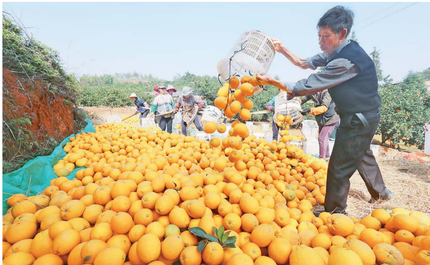
▲2018年11月23日,江西赣州市于都县新陂乡的果农在堆放采摘的脐橙。