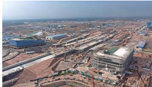
成都天府机场 T2 航站楼封顶

日前,成都天府国际机场 T2 航站楼主体结构全面封顶(8月27日拍摄)。机场预计明年年底基本建成,2021年上半年建成投运。