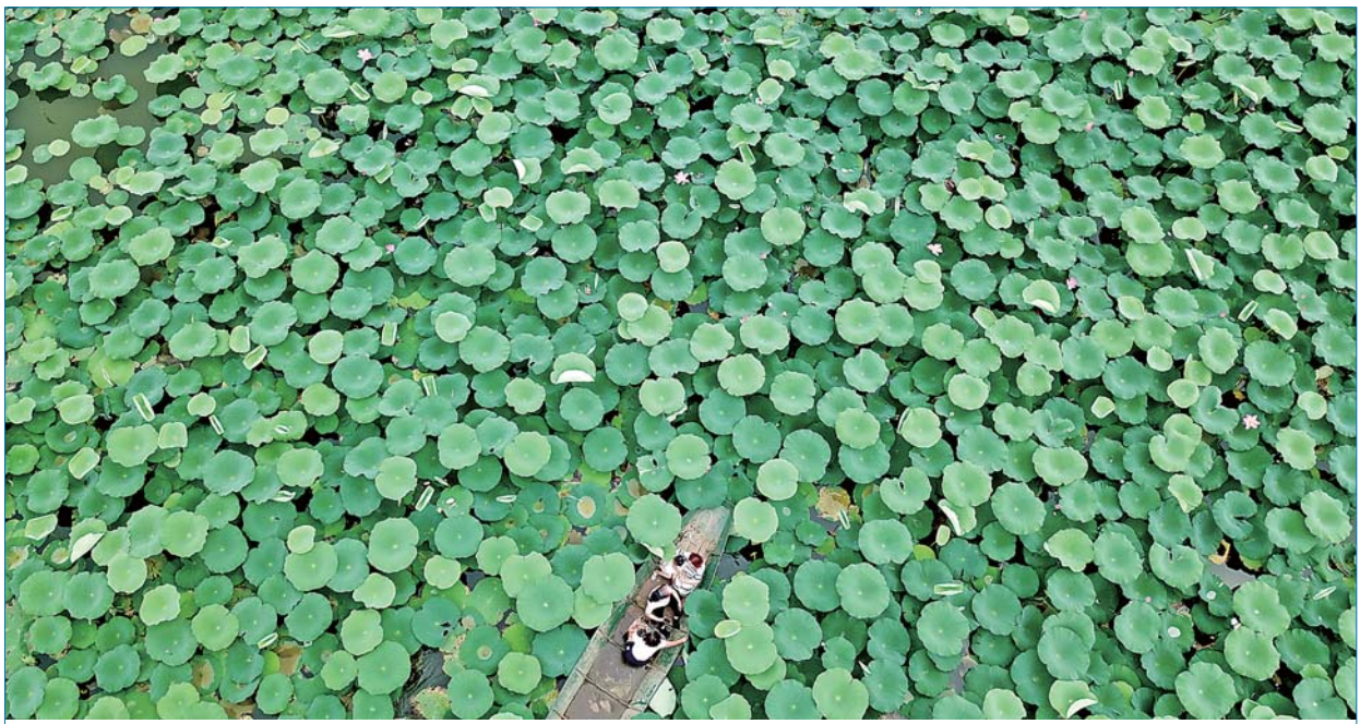
▲7月22日，游客在河北省涿州市榛子镇南平庄村的荷塘内游览(无人机拍摄)。近年来，榛子镇将一千余亩鱼塘改造为荷塘，建设以赏荷为主题的特色小镇，发展乡村旅游，为乡村振兴注入活力。 新华社记者曹宇摄

意见强调，各地各部门要加强组织领导，把组织实施好中国农民丰收节作为“三农”工作重要内容摆上长期议事日程，明确责任分工，加强研究部署。农业农村部要发挥牵头组织作用，会同有关部门统筹谋划节日期间庆祝活动，加强协作配合，形成长效工作机制。同时，加强对各地庆祝活动的管理和指导，确保庆祝活动不走偏、不变味，严守纪律规定，把活动出发点和落脚点放在提升农民群众获得感上，避免形式主义和奢靡之风，严防搭车搞庆典和增加农民负担。