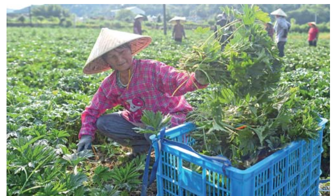
▲7月20日，浙江诸暨市湍浦镇的益母草种植研发中心基地内450亩益母草陆续开始采收。益母草规模种植促进了当地农民增收。据介绍，益母草一年可收两次，按目前市场收购价估算，每亩年产值约8万元。