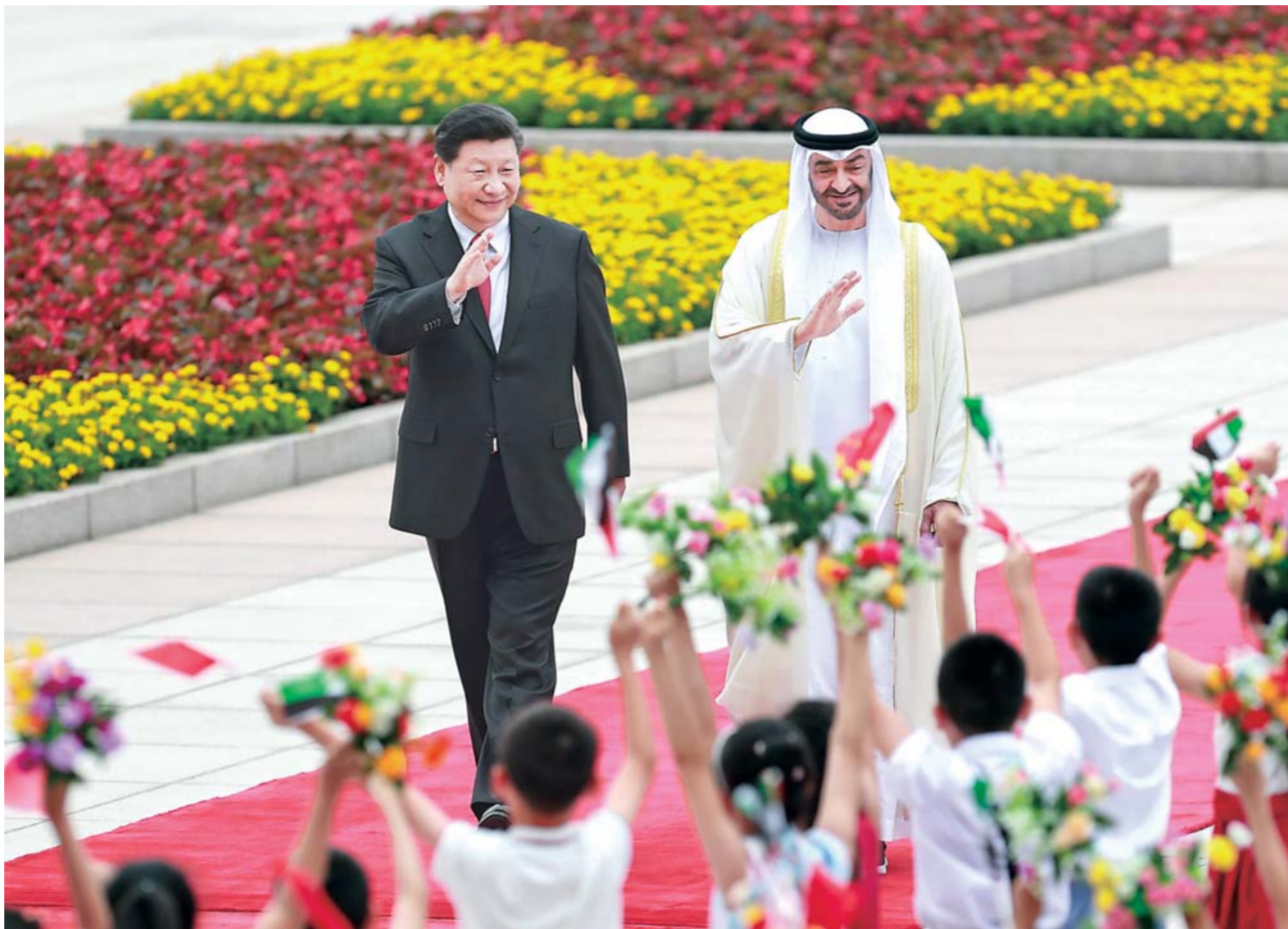
▲7月22日,国家主席习近平在北京人民大会堂同阿联酋阿布扎比王储穆罕默德举行会谈。这是会谈前,习近平在人民大会堂东门外广场为穆罕默德举行欢迎仪式。