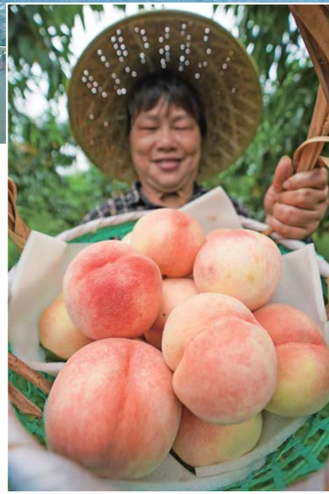
▲7月16日，在无锡市阳山镇桃源村大路头水蜜桃专业合作社，农户展示采摘的水蜜桃。

服务机构构成创新联盟……6月26日开幕的首届南京创新周，汇集一大批科技大咖、创业项目和科技产品，世界瞩目。目前常住南京的外籍人士超过3万人，外资企业逾8000家，这个六朝古都重新焕发活力。