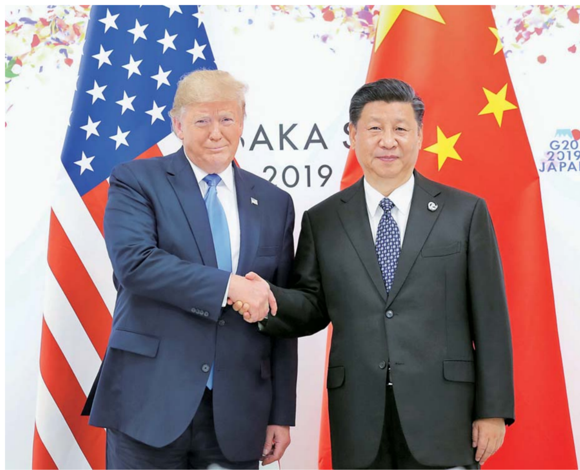
▲6月29日,国家主席习近平同美国总统特朗普在大阪举行会晤。

新华社大阪6月29日电(记者陈贻、霍小光、骆璐)国家主席习近平29日同美国总统特朗普在大阪举行会晤。两国元首就事关中美关系发展的根本性问题、当前中美经贸摩擦以及共同关心的国际和地区问题深入交换意见,为下阶段两国关系发展定向把舵,同意推进以协调、合作、稳定为基调的中美关系。