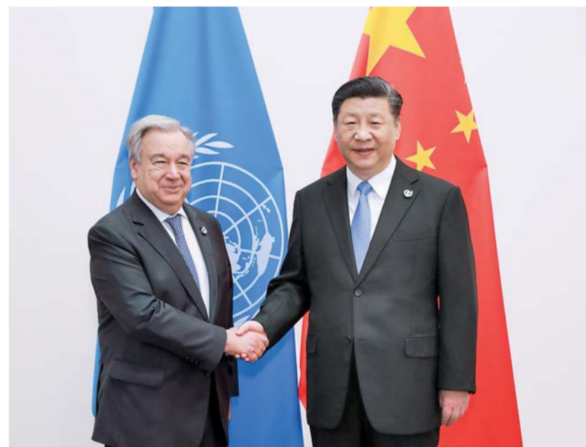
▲6月28日,国家主席习近平在大阪会见联合国秘书长古特雷斯。

古特雷斯表示,当前国际形势正处在关键时刻,贸易领域和海湾形势出现紧张,世界面临促进多边主义、遵守法制意愿不足的情况。越是这样的时刻,越应当发挥联合国的作用。联合国赞赏中国长期以来对联合国的支持,高度评价中国在推动朝鲜半岛问题政治解决、应对气候变化、推进可持续发展等方面作出的重要贡