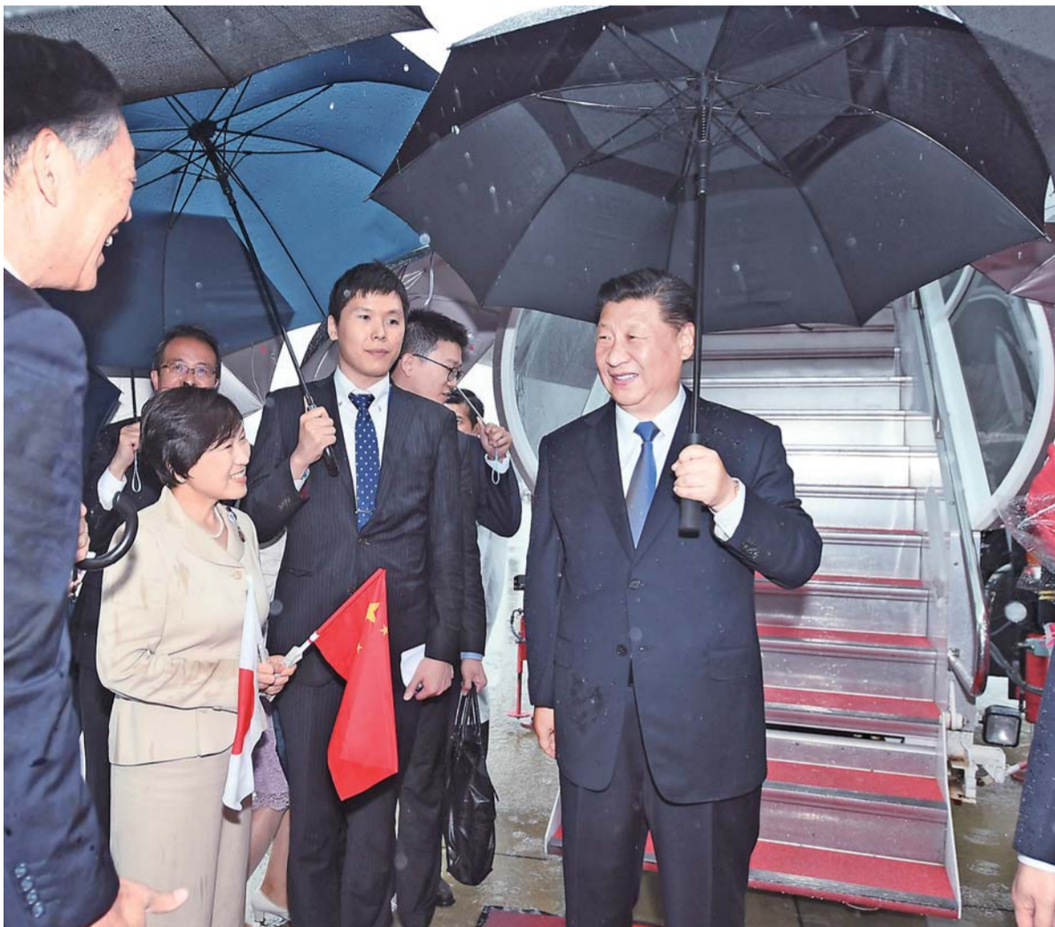
六月二十七日,国家主席习近平乘专机抵达大阪,应日本首相安倍晋三邀请,出席二十国集团领导人第十四次峰会。日本政府高级官员、大阪府知事等在舷梯旁迎接。

新华社大阪6月27日电(记者沈红辉)国家主席习近平27日乘专机抵达大阪,应日本首相安倍晋三邀请,出席二十国集团领导人第十四次峰会。